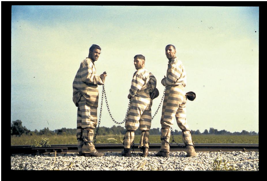
Filmskapere velger ofte fangeklær som tydelig signaliserer fange-statusen, uavhengig av om det er historisk korrekt, og stripene er fortsatt det mest ikoniske uttrykket for fangenskap. Her fra filmen O brother, where art thou?